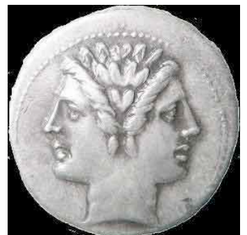
Münze mit dem römischen Gott Janus, der nach vorne und zurück blickt und der dem Monat Januar den Namen gegeben hat.