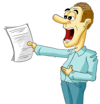
der Inhalt der Rede