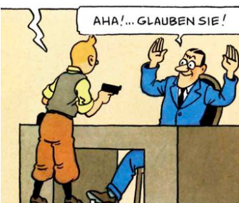
VERBLÜFFEND, DIESER KLEINE MECHANISMUS UNTERM FUSS!

Wer andern eine Grube gräbt fällt oft selbst hinein.