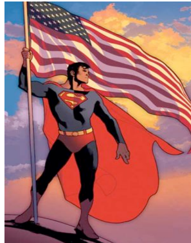
Heute, nach 70 Jahren

Um die Figur von Superman wurde schon lange keine relevante Geschichte mehr erzählt, und schon lange hat er dem Genre keine Impulse mehr geben können. Superman ist ein Logo, und das schränkt seinen psychologischen und erzählerischen Spielraum ein – ganz im Gegensatz zu Batman und gewissen Heroen der sechziger Jahre wie Spiderman oder die X-Men, die zwar weniger Symbolkraft haben, aber interessantere und entwicklungsfähige Figuren abgeben.