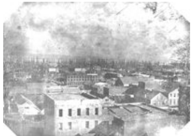
Fotografie: Der Hafen von San Francisco im Jahre 1849. Im Hintergrund Hunderte von verlassenen Schiffen.

Und immer gewaltiger wird dieser beispiellose Sturm nach Gold; die Nachricht ist in die Welt