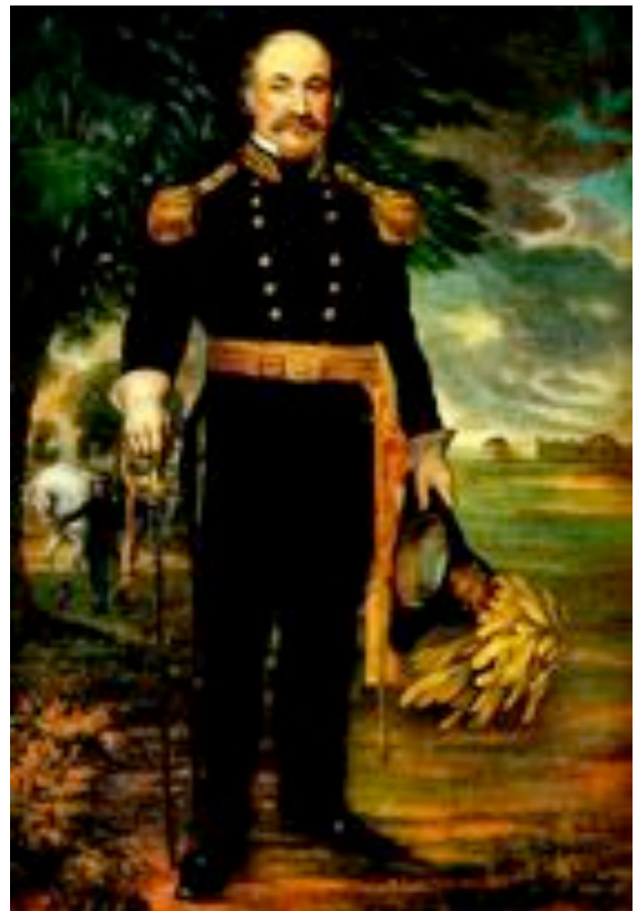
Sutter als „General“. Im Hintergrund „Neu Helvetien“.

selbst baut er Häuser und üppige Farmen, lässt ein Klavier von Pleyel hundertachtzig Tagereisen weit aus Paris kommen und eine Dampfmaschine mit sechzig Büffeln von New York her über den ganzen Kontinent. Er hat Kredite und Guthaben bei den größten Bankhäusern Englands und Frankreichs, und nun, fünfundvierzig Jahre alt,