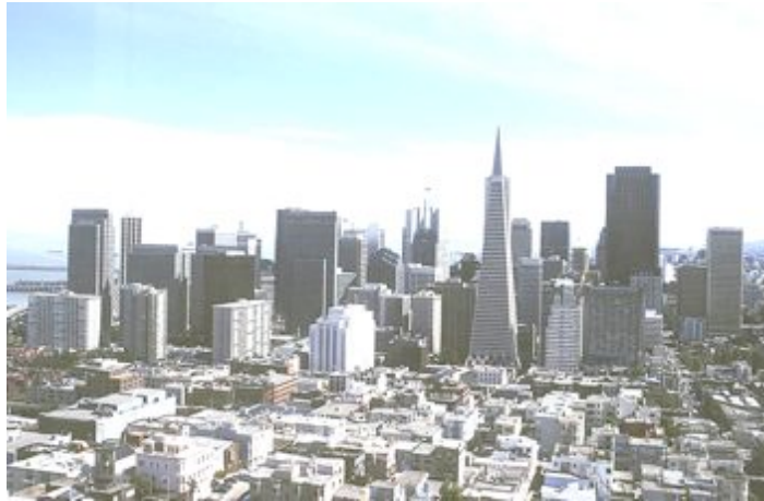
Downtown San Francisco. Heutiger Wert?