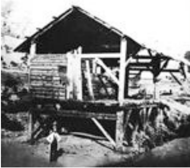
Sutters Sägemühle, wo 1848 das erste Gold gefunden wurde. Foto von 1852.

ab und zieht aus der Tasche eine Handvoll Sand mit ein paar gelben Körnern darin. Gestern, beim Graben sei ihm dieses sonderbare Metall aufgefallen, er glaube, es sei Gold, aber die anderen hätten ihn ausgelacht. Sutter wird ernst,