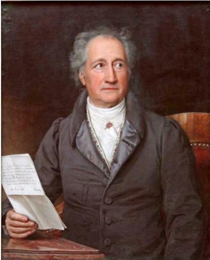
Johann Wolfgang von Goethe um 1828

Um 1770 entsteht in Deutschland mit dem „Sturm und Drang“ eine Bewegung junger Schriftsteller, die sich als Gegenpol zur vernunft- und verstandesbetonten Aufklärung versteht. Diese neuen Literaten stellen das Gefühl und die grenzenlose Selbstentfaltung des Einzelnen in den Mittelpunkt. Die wichtigsten Vertreter dieser kurz dauernden Bewegung sind Johann Wolfgang Goethe und Friedrich Schiller. Mit ihren frühen Dramen wie Goethes „Götz von Berlichingen“ und Schillers „Die Räuber“ und „Kabale und Liebe“ protestierten sie leidenschaftlich gegen die herrschende Ordnung. Goethes Briefroman „Die Leiden des jungen Werther“ wird als Spiegelbild für das Lebensgefühl der jungen Generation zu einem Kultbuch für die damaligen Intellektuellen.