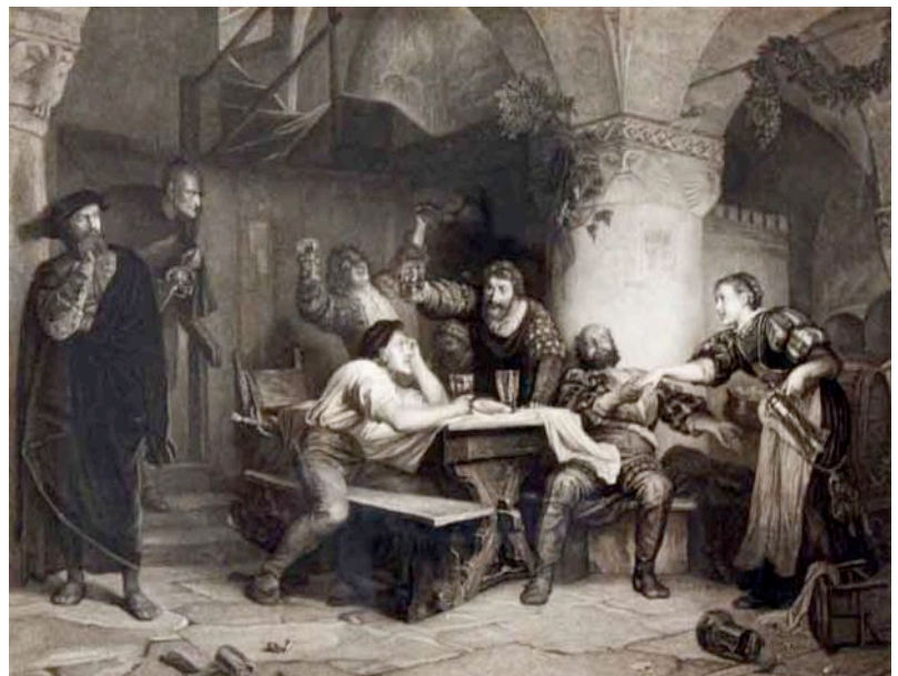
In Auerbachs Keller, Leipzig. (Szene aus dem „Faust“)

Der junge Goethe lernte auch Klavier spielen, fechten und reiten. Mit 16 Jahren zog er nach Leipzig, um, dem Wunsch seines Vaters folgend, Rechtswissenschaft zu studieren. Eigentlich hätte er lieber in Göttingen alte Sprachen, Geschichte und Literatur studiert. Öfters als in rechtswissenschaftlichen Vorlesungen zu sitzen, genoss er dann das Studentenleben: „Mein Leipzig lob ich mir! Es ist ein Klein-Paris und bildet seine Leute“ wird später in seinem Werk „Faust“ zu lesen sein. In Leipzig stieß der junge Goethe auf die Motive für den Faust-Stoff. Er setzte mit seiner Dichtung auch dem „Auerbachs Keller“ - einer Lokalität, in der er gern zechte - ein Denkmal.