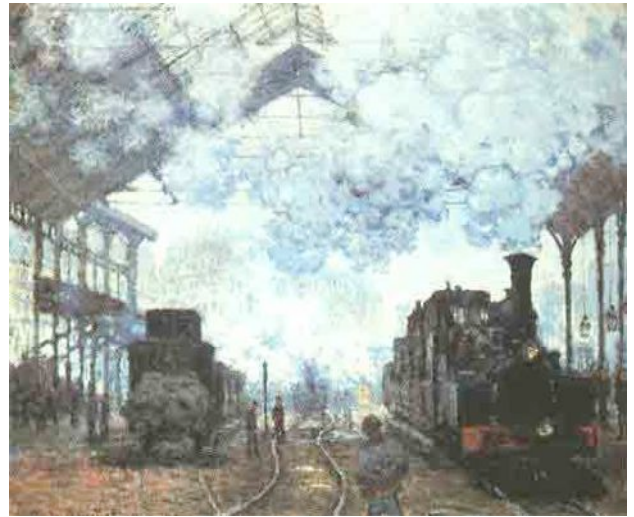
CLAUDE MONET: „GARE SAINT LAZARE“ 1877

Als 1804 die Dampflokomotive erfunden wurde, entstand im Laufe der Zeit ein Netz von Zugverbindungen.