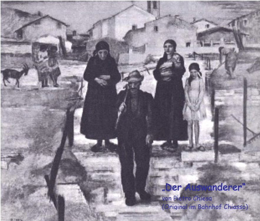
„Der Auswanderer“ von Pietro Chiesa (Original im Bahnhof Chiasso)