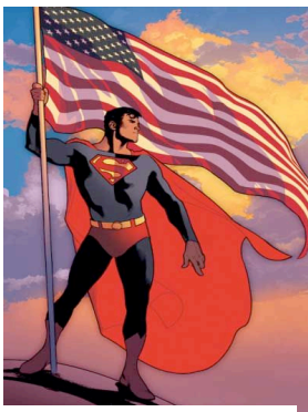
In den Nullerjahren, zu Zeiten von 9/11

Das Ende des Kriegs raubte den Superhelden die Daseinsberechtigung, die meisten verschwanden so plötzlich, wie sie aufgetaucht waren – bis auf die Dauerbrenner Batman, Wonderwoman und Superman. Diese mussten sich nun neu orientieren. Und so schlug sich Superman fortan mit Verbrechergenies herum, mit außerirdischen Bedrohungen, Robotern und anderen Schuftten. Dabei wurde der ebenso geniale wie großwahn sinnige Lex Luthor zu seinem Erzfeind. In den sechziger Jahren wurde Superman zur Comicfigur für Kinder