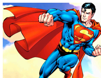
Superman zu Zeiten von Donald Trump

Um die Figur von Superman wurde schon lange keine relevante Geschichte mehr erzählt, und schon lange hat er dem Genre keine Impulse mehr geben können. Superman ist ein Logo, und das schränkt seinen psychologischen und erzählerischen Spielraum ein – ganz im Gegensatz zu Batman und gewissen Heroen der sechziger Jahre wie Spiderman oder die X-Men, die zwar weniger Symbolkraft haben, aber interessantere und entwicklungsfähige Figuren abgeben.