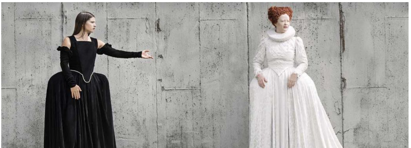
Protagonistin Maria Stuart und ihre Antagonistin Elizabeth I. in Schillers «Maria Stuart»

Beispiel: Heinrich Kleist „Der zerbrochene Krug“ (1811)