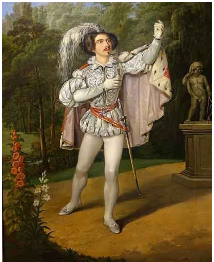
Titelfigur aus «Don Carlos» von Friedrich Schiller in einer Inszenierung von ca. 1840

Dieses Beziehungsgefüge kann sich im Lauf der Handlung mehrfach ändern.