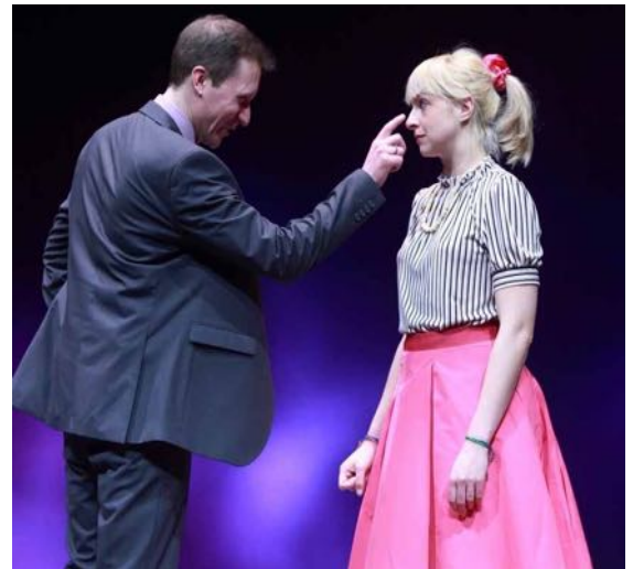
«Nora oder Ein Puppenheim» von Henrik Ibsen. Das Stück von 1879 übt starke Kritik an der damaligen gesellschaftlichen Rollenverteilung von Mann und Frau, die für Frauen nur die Aufgabe als gehorsame Ehefrau und Mutter vorsah.