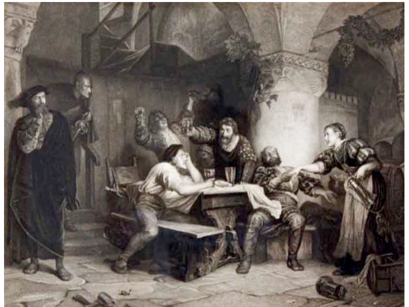
In Auerbachs Keller, Leipzig. (Szene aus dem „Faust“)

Der junge Goethe lernte auch Klavier spielen, fechten und reiten. Mit 16 Jahren zog er nach Leipzig, um, dem Wunsch seines Vaters folgend, Rechtswissenschaft zu studieren. Eigentlich hätte er lieber in Göttingen alte Sprachen, Geschichte und Literatur studiert. Öfters als in rechtswissenschaftlichen Vorlesungen zu sitzen, genoss er dann das Studentenleben: „Mein Leipzig lob ich mir! Es ist ein Klein-Paris und bildet seine Leute“ wird später in seinem Werk „Faust“ zu lesen sein. In Leipzig stieß der junge Goethe auf die Motive für den Faust-Stoff. Er setzte mit seiner Dichtung auch dem „Auerbachs Keller“ - einer Lokalität, in der er gern zechte - ein Denkmal.