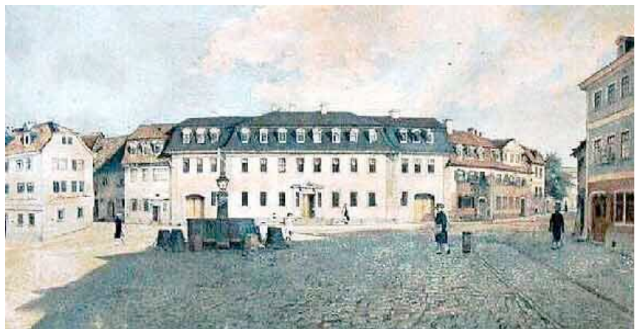
Am Frauenplan. Goethes späterer Wohnsitz in Weimar.

Die amtliche Tätigkeit war mit der Vernachlässigung seiner schöpferischen Fähigkeiten verbunden. Das löste nach dem ersten Weimarer Jahrzehnt eine persönliche Krise aus, der sich Goethe durch die Flucht nach Italien entzog. Die zweijährige Italienreise empfand er wie eine „Wiedergeburt“. Ihr verdankte er die Vollendung wichtiger Werke wie z.B. „Iphigenie auf Tauris“. Die italienische Landschaft, Baukunst und Literatur beeindruckten ihn tief . Italiens