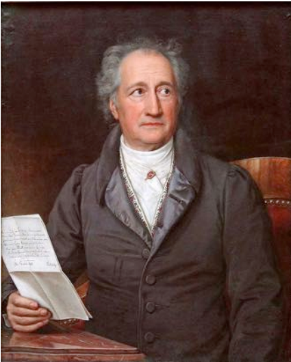
Johann Wolfgang von Goethe um 1828

Um 1770 entsteht in Deutschland mit dem „Sturm und Drang“ eine Bewegung junger Schriftsteller, die sich als Gegenpol zur vernunft- und verstandesbetonten Aufklärung versteht. Diese neuen Literaten stellen das Gefühl und die grenzenlose Selbstentfaltung des Einzelnen in den Mittelpunkt. Die wichtigsten Vertreter dieser kurz dauernden Bewegung sind Johann Wolfgang Goethe und Friedrich Schiller. Mit ihren frühen Dramen wie Goethes „Götz von Berlichingen“ und Schillers „Die Räuber“ und „Kabale und Liebe“ protestierten sie leidenschaftlich gegen die herrschende Ordnung. Goethes Briefroman „Die Leiden des jungen Werther“ wird als Spiegelbild für das Lebensgefühl der jungen Generation zu einem Kultbuch für die damaligen Intellektuellen.