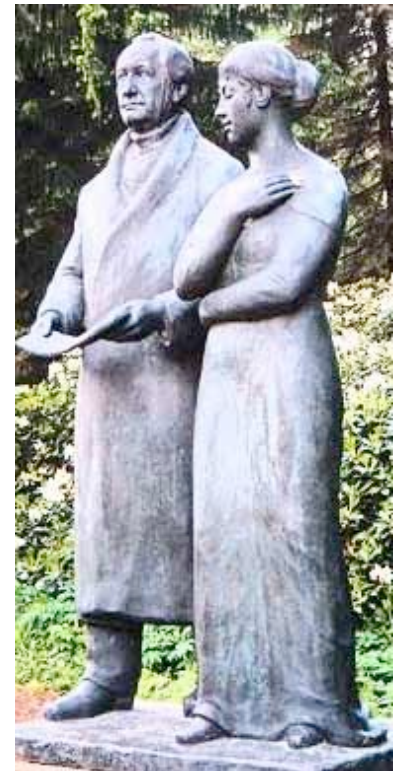
Goethe-Denkmal in Marienbad (heute Tschechien)

Auch noch im Alter ergriff Goethe immer wieder die Leidenschaft für schöne und geistvolle Frauen . Aus seiner Beziehung zu Marianne von Willemer entstand der „West-Östliche Diwan“, als Zweiundsiebzigjähriger verliebte er sich bei einem Kuraufenthalt in Marienbad in die neunzehnjährige Ulrike von Levetzow - den Schmerz über die Abweisung des Heiratsantrags drückte Goethe in seiner „ Marienbader Elegie “ aus, mit deren Niederschrift er im September 1823 auf seiner Abreise aus Marienbad in der Kutsche begann. Bis ins höchste Alter – er starb 1832 im Alter von fast 83 Jahren – war Goethe von einer erstaunlichen Schaffenskraft . Seine Lebenserinnerungen schrieb er auf in seinem Werk „ Dichtung und Wahrheit “.