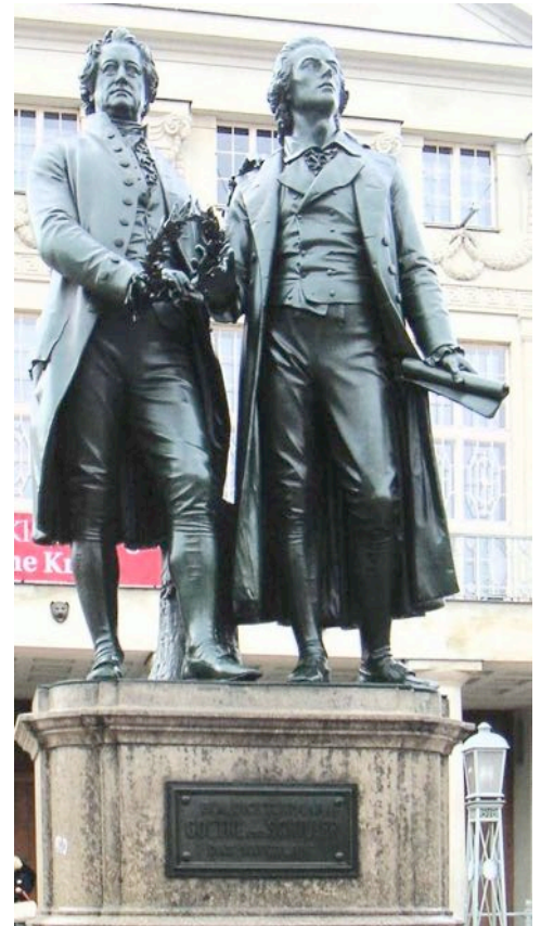
Goethe und Schiller, Denkmal in Weimar

Goethe wurde immer berühmter . Menschen aus vielen Ländern pilgerten nach Weimar, um ihm ihre Verehrung zu zollen. Goethe zog sich mehr und mehr aus der Öffentlichkeit zurück. Er baute sich seine eigene Welt der Schönheit und der idealen Formen auf und beschäftigte sich mit Naturforschungen.